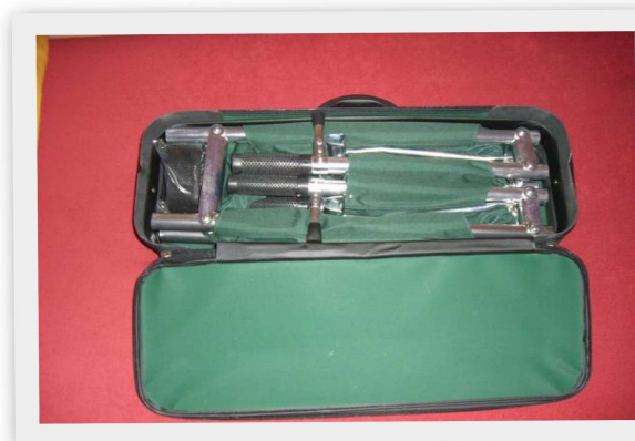
Pohled na uložení nosítek po otevření zipu.