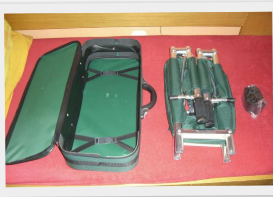
Otevřený obal, složená nosítka, 2 ks složených zabezpečujících popruhů.