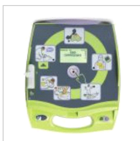
AED ZOLL plus