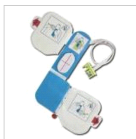
elektrody pro AED ZOLL plus