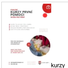
kurzy první pomoci