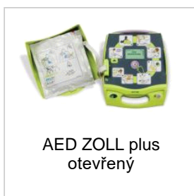
AED ZOLL plus otevřený