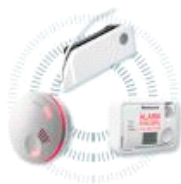
propojovací modul XW100