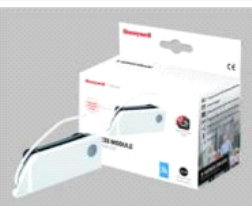
propojovací modul XW100