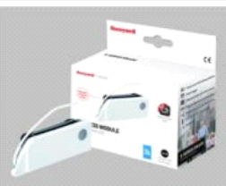
propojovací modul XW100